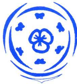
Flower diagram Blütendiagramm Virágdiagramm